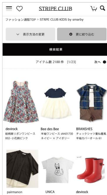
STRIPE CLUB KIDS by smarby スマートフォン版 画面イメージ