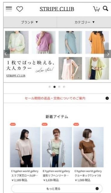
STRIPE CLUB トップページ