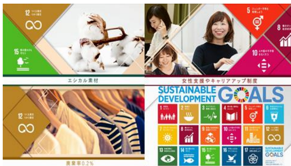
ストライプオリジナル動画より