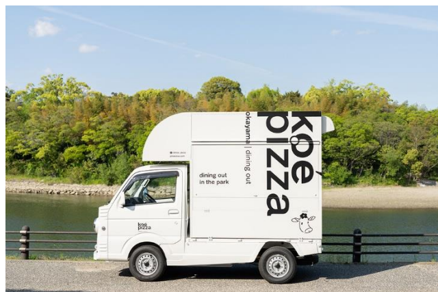
(koe pizza キッチンカー)