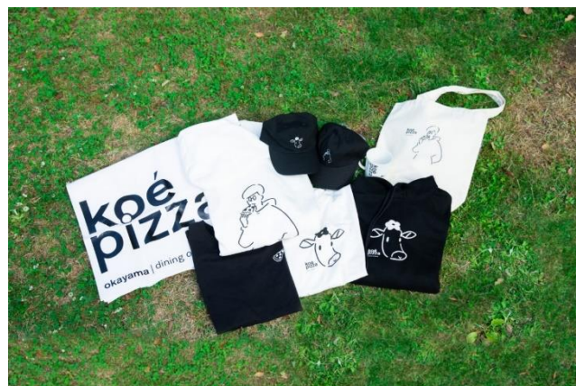
(koe pizza オリジナルグッズ)